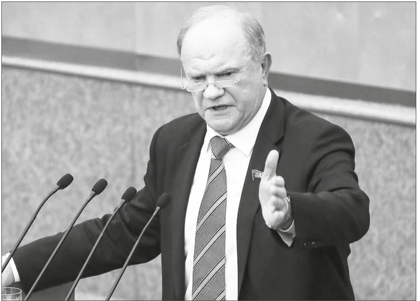
Председатель ЦК КПРФ Г. А. Зюганов

справедливости. Мы будем действовать ответственно и энергично ради будущего своей Отчизны! Законы истории неумолимы. Победа будет за политикой правды и справедливости, за патриотической Россией!